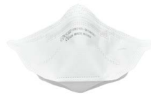
BLS 502 - BLS 503